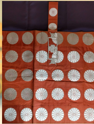
現如上人御依用 御紋付五条袈裟