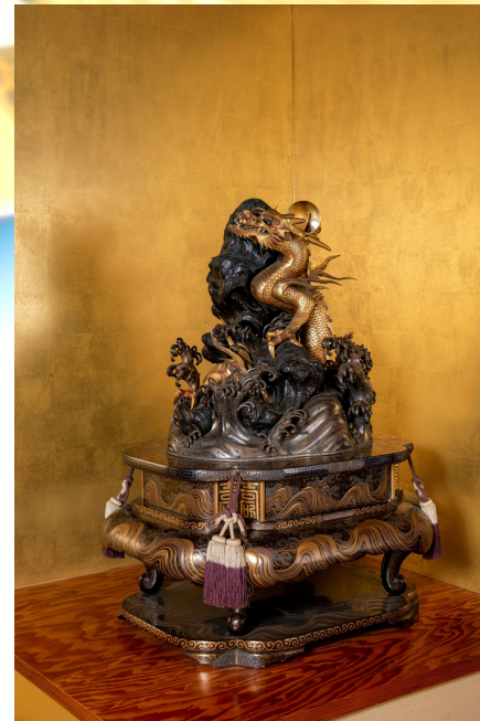
金銀水龍彫大置物 時繪臺附 明治天皇御下賜