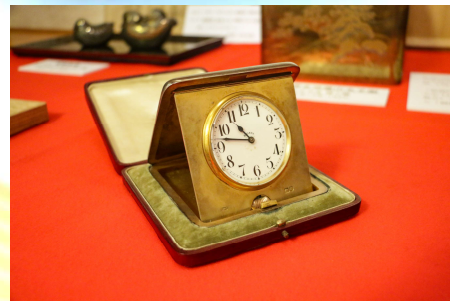
枕時計 明治天皇御遺物