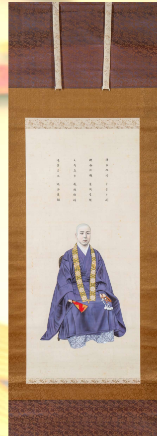
十九歳 蝦夷開化御像