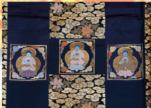
現如上人御依用 七條袈裟